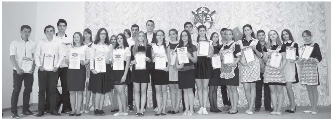
Победители муниципального этапа Всероссийской предметной олимпиады школьников.