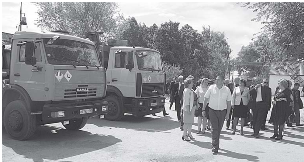
Гости ст.Казанской в Верхнедонском МП ПУЖКХ и в центральном парке станицы.

Дальнейшая часть мероприятия прошла под открытым небом. Вначале участники посетили мемориал павшим воинам, осмотрели центральный парк ст.Казанс-