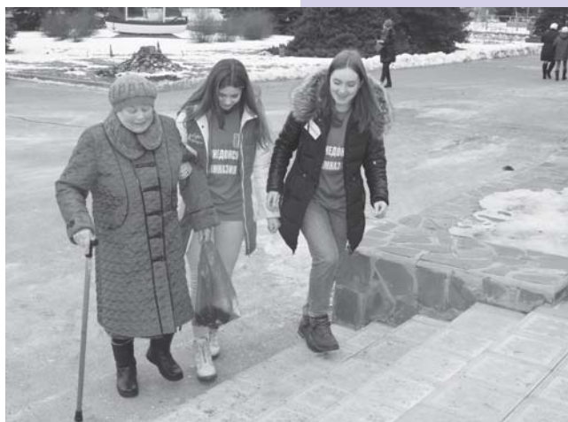
На всех крупных избирательных участках района избирателей встречали волонтеры.