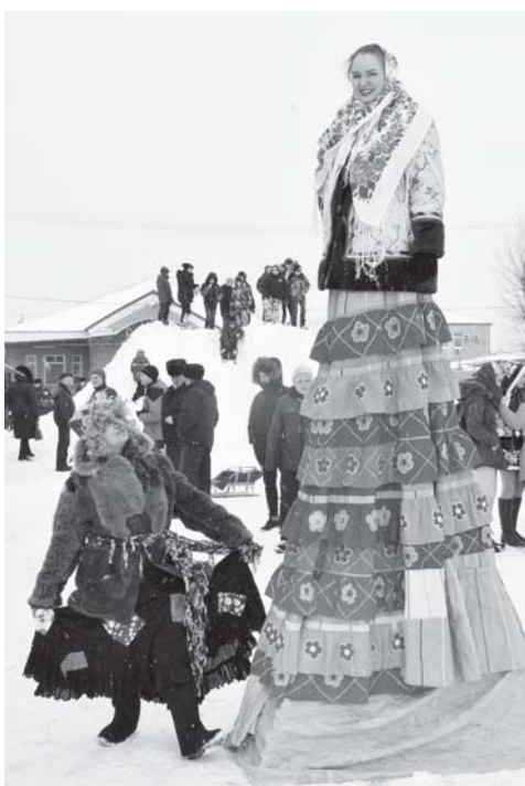
Зимние забавы увлекли всех.

На площади выстроились в ряд на смотрины одна краше другой куклы Масленицы из всех сельских поселений, соблазняя публику сделать селфи в их компании. Рядом – тоже фото-зона - интерьер казачьей горницы и казачка великанского роста – интересные объекты для памятных фотографий. Около Центра детского творчества выставка-ярмарка искусных изделий мастеров ручной работы.