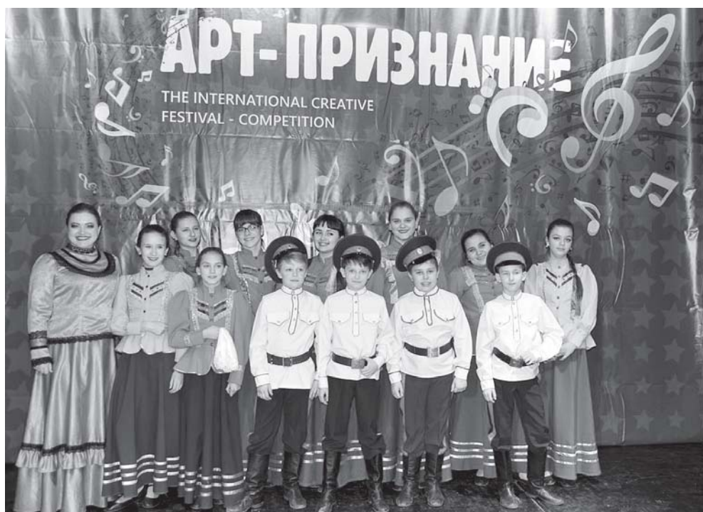
Детский образцовый фольклорный ансамбль «Донские узоры».