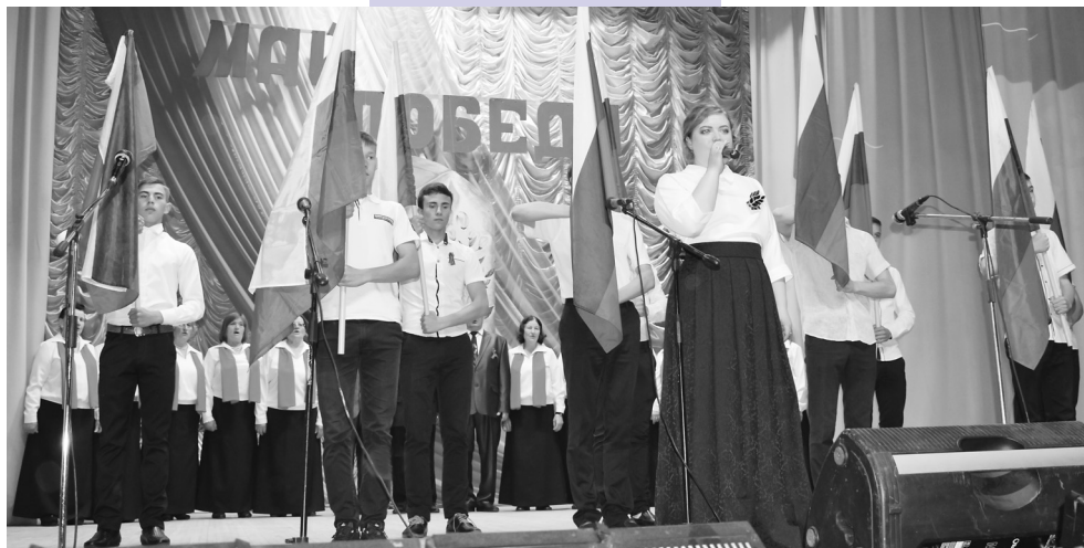
Большой праздничный концерт в честь Дня Победы.