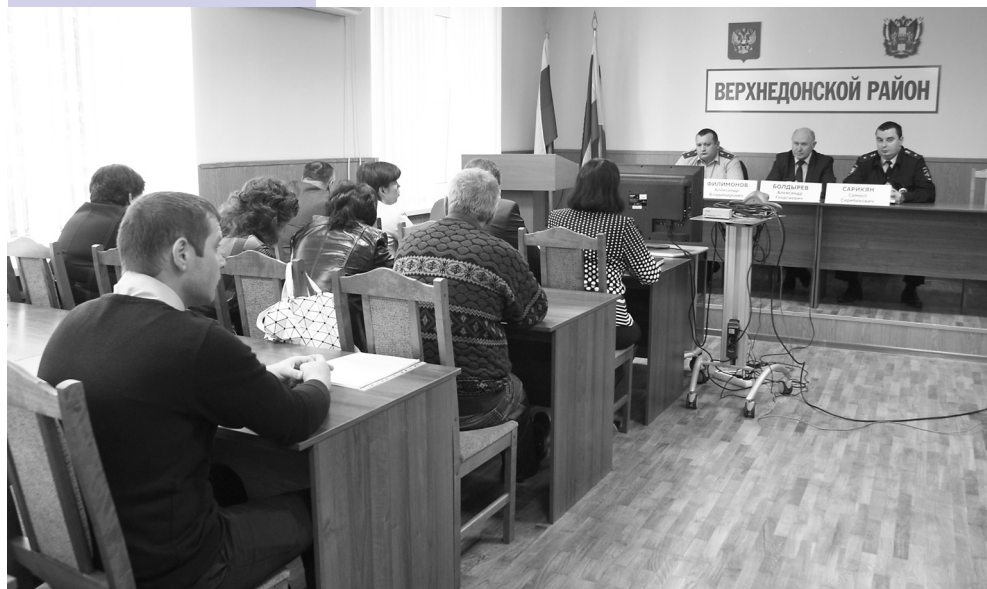
Заседание районной комиссии по противодействию коррупции.