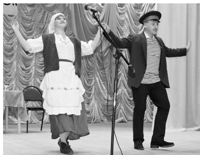
Дядя Митя и тётя Шура из лирической комедии «Любовь и голуби» до сих пор покоряют зрительские сердца.

Завершилась церемония закрытия Года Российского кино совместным исполнением песни о хорошем настроении из кинофильма «Карнавальная ночь».