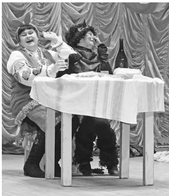
Успех и призвание ни одного поколения завоевали герои произведения «Вечера на хуторе близ Диканьки»

полнением песни о хорошем настроении из кинофильма «Карнавальная ночь».