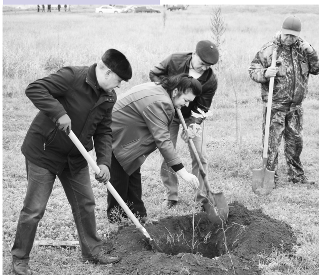
В этот день все дружно вышли на посадку деревьев. (Продолжение темы на 2 стр.)

Также в этот день силами работников администрации Казанского сельского поселения была обновлена аллея на набережной реки Дон. Тут было высажено 35 каштанов. Пятьдесятю саженцами каштана, липы, клёна и рябины пополнился парк на территории стационара. Двадцать саженцев были высажены на территории Верхнедонской гимназии. Хорошо потрудились в этот день