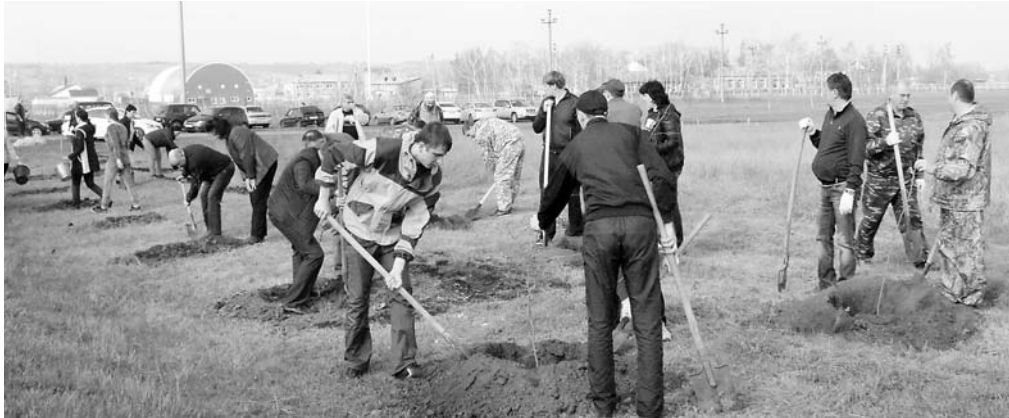
Посадка деревьев вдоль дороги по ул. Молодёжной в ст. Казанской.

9 апреля в Ростовской области прошел весенний День древонасаждений, который стал доброй традицией и в нашем районе.