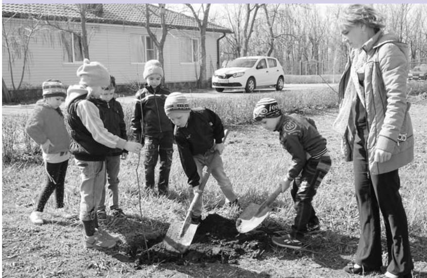
Воспитанники детского сада «Березка» и филиала «Родничок» с удовольствием сажали деревца на прилегающих территориях.